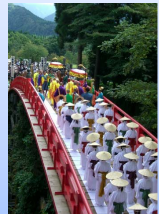
芦峯寺 布橋灌頂会