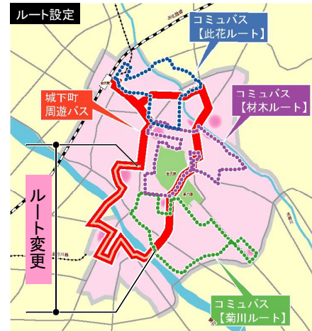
ふらっと一周ルート案

●バス待ち時間を快適に⇒バス停の工夫(デザインの洗練、インフォメーションボードの付加、バス停ナンバーの表記、店舗内でのバス接近情報の案内、バス停前店舗の 1 F 部分セットバック)