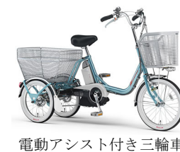
電動アシスト付き三輪車