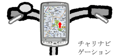
チャリナビゲーション