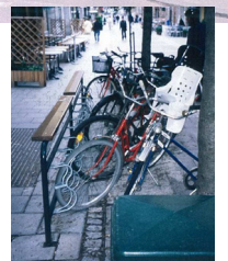
ちょっとした空間を利用した駐輪スペース